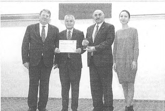
Кыргыз-Түрк "Манас" университетинин «Web of Science Awards-2017» электрондук маалымат базасында илимий макалаларды көп жарыялагандыгы үчүн "Эн таасирдүү жогорку окуу жайы" деп табылды. Сыйлык 10-ноябрда Кыргыз улуттук илимдер академиясында Илим күнүнө карата өткөн иш-чарада тапшырылды.

Иш-чарада «Clarivate Analytics» (Thomson Reuters) компаниясынын өкүлдөрү мыкты рейтингге жетишкен кыргызстандык окумуштууларга жана жогорку окуу жайларына сыйлыктарды ыйгарды. Аталган рейтинг боюнча Кыргыз-Түрк "Манас" университетинин Кыргызстанда илимий макалаларды эң көп жарыялагандыгы үчүн сыйланды.