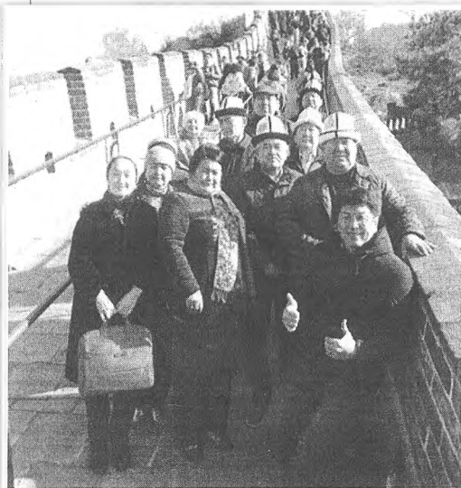
окутуучулар, студенттер академиялык мобилдүүлүк багытындагы түрдүү программалардын негизинде жыл бою тынымсыз тажрыйба алмашып турушат.

Жарманкенин экинчи бөлүгү, чыгармачыл студенттер тарабынан даярдалган концерттик программасы менен коштолуп, кызыктуу оюн-зооктор менен көрүүчүлөргө майрамдык маанай тартууланды.