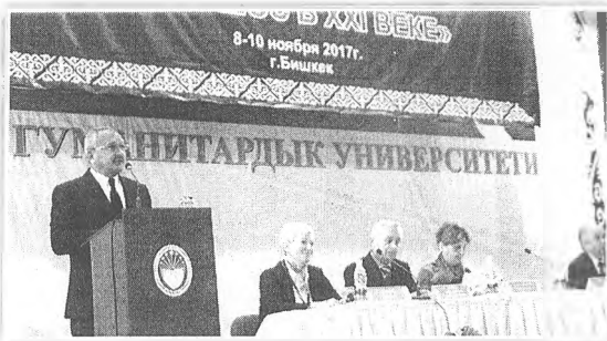
В Бишкекском гуманитарном университете прошел XIII Международный форум «Диалог языков и культур СНГ и ШОС в XXI веке». Об этом сообщила пресс-служба университета.

Форум организован совместно с Московским государственным лингвистическим университетом при поддержке Межгосударственного фонда гуманитарного сотрудничества государств-участников СНГ.